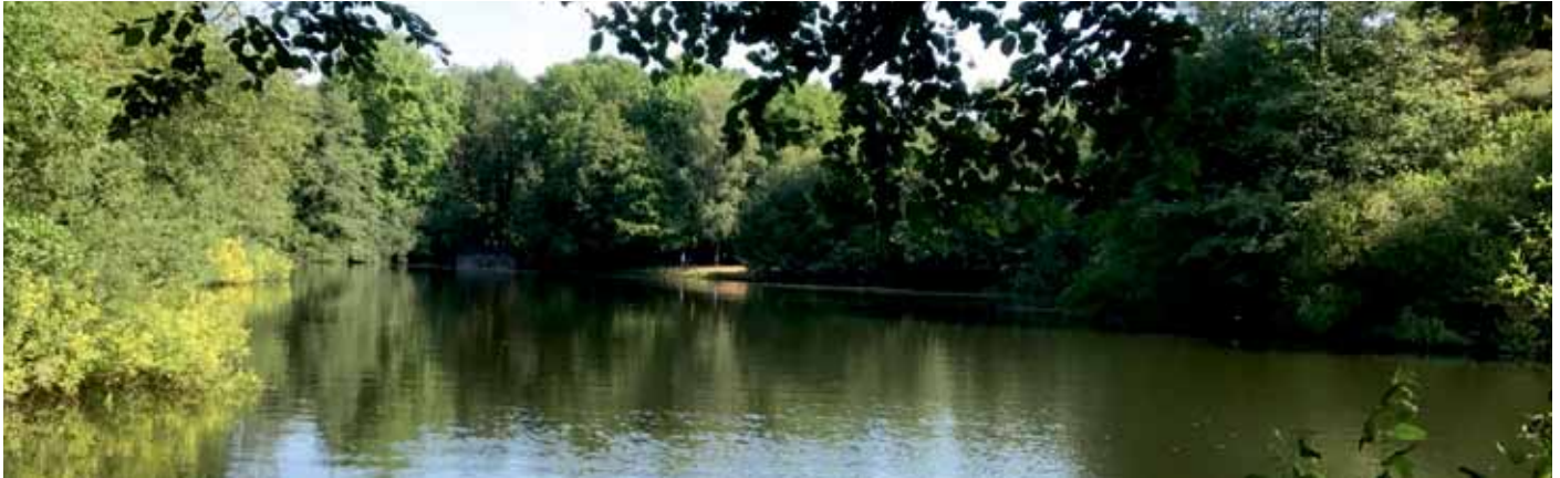
Ein Stück dörfliche Lebensqualität, der Hasselbach-Stausee.

(dd) Anfang der 80er Jahre wurde in Pivitsheide „ordentlich“ demonstriert. Ja, Sie lesen richtig, es gab tatsächlich eine beschauliche Dorfdemonstration. Gut, nichts für die Tagesschau und leider auch nichts für die „aktuelle Stunde“, aber für die Dorfjugend (aus der ausnahmslos die Demonstrantengruppe bestand) war die Aktion eine große Sache! Von den Vorbeikommenden zwar nur belächelt, tat das der Motivation aber keinen Abbruch.