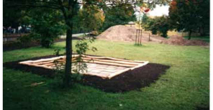
...der schöne Spielplatz erbaut.

in Form der ersten Einzäunung. In enger Abstimmung mit der Verwaltung wurden rund 300 Gehölze gepflanzt und über 400 Arbeitsstunden von den Pivitsheidern ehrenamtlich geleistet. Schließlich war es am 26. April 1997 soweit, der Spielplatz Tickaland wurde durch den Bürgermeister der Stadt Detmold, Friedrich Brakemeier eingeweiht. Der Name „Tickaland“ wurde in einem Wettbewerb der Pivitsheider Kindergärten gefunden. Im DRK-Kindergarten Purzelbaum hatte man gerade ein Lied vom Tickaland einstudiert.