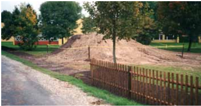
Vor 20 Jahren wurde mit viel Fleiß...

Ein Blick in alte Zeitungen und Fotoalben zeigt, eigentlich ist der Spielplatz Tickaland in Pivitsheide VH schon 21 Jahre alt. Denn vor mehr als 20 Jahren überlegten die Mitglieder im Ortskartell Pivitsheide VH, was man mit der 1500 qm großen Brachfläche vor der Hasselbachschule machen könnte. Die „Hundewiese“ war den Pivitsheidern schon lange ein Dorn im Auge. Da kam der Wettbewerb „Unser Dorf soll schöner werden“ gerade recht, um diese Fläche deutlich aufzuwerten. Mit dem Hasselbachtich und weiteren Situationen im Ort hatte man beim