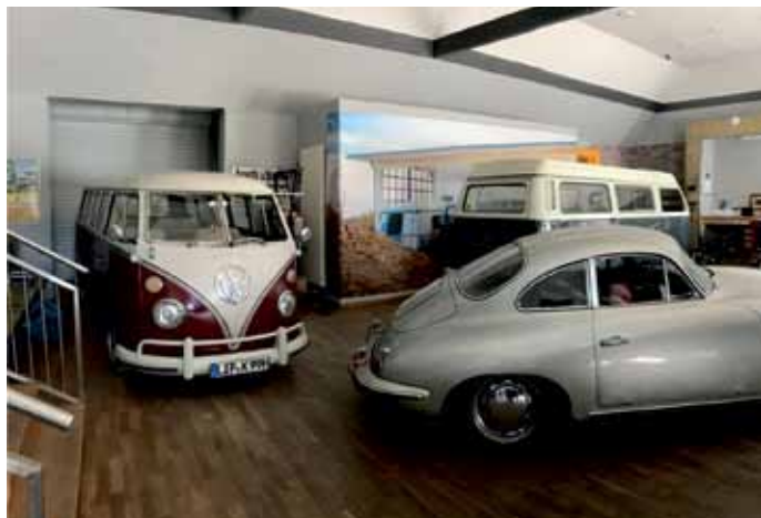
Die Kulturwerkstatt: (Auto-)Kultur wohin man blickt.

am heutigen Tag dekorativ im alten Gastsaal platziert hat. Ein alter, aber top erhaltener VW T1 Bus aus den 60ern, ein T2a aus ehemaligem Feuerwehrbestand (beide im Originallack), ein grauweißer T2b Camper und eine T1 Pritsche im noch zu bearbeitenden Zustand füllen die Halle mit reichlich Nostalgie.