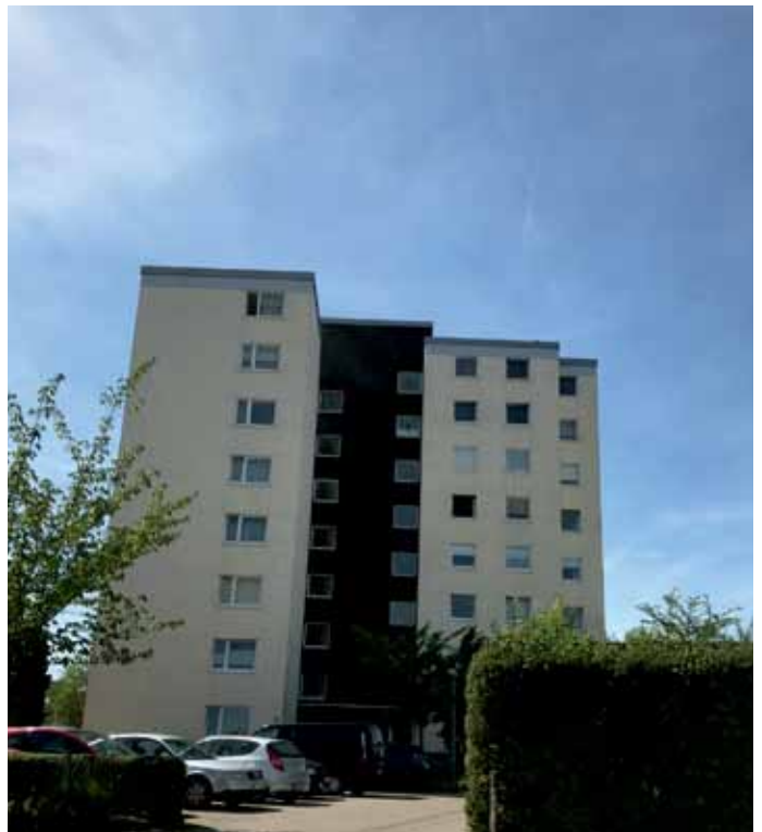
Schöne Aussicht oft nur von innen. Fast jedes stattnahe Dorf hat seine Bausünden.

nötig halten, den Finger in die Wunde legen oder vielleicht auch einmal mit diesem auf etwas zeigen! Dieses dann zu bewerten und gegebenenfalls auch zu kommentieren (gerne auch als Leserbrief) bleibt dem Leser überlassen.