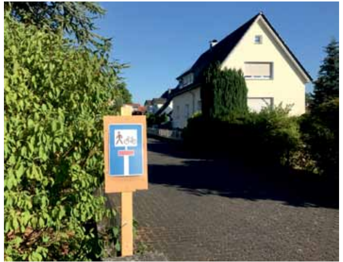
Die Not macht erfinderisch: Anwohner helfen sich mit selbst und stellen gemalte/gebastelte Schilder auf.

Nun ja, wir bleiben dran. Vorerst heißt es leider „durchhalten“ liebe Iusendörper!