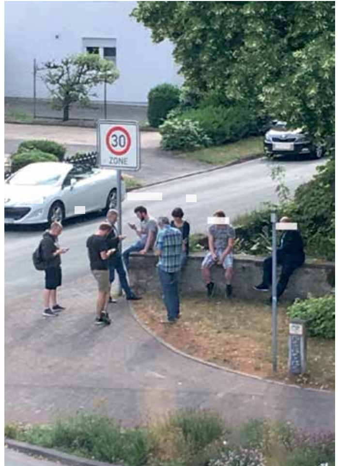
Nichts besseres zu tun... Pokemon-Jäger an der Stoddartstraße in Pivitsheide.

Es bleibt aber natürlich festzuhalten, dass die Spieler einfach nur „zocken“ (spielen) und, ähnlich wie die oft gleichaltrigen Männer auf unseren Sportplätzen dem Ball, einem