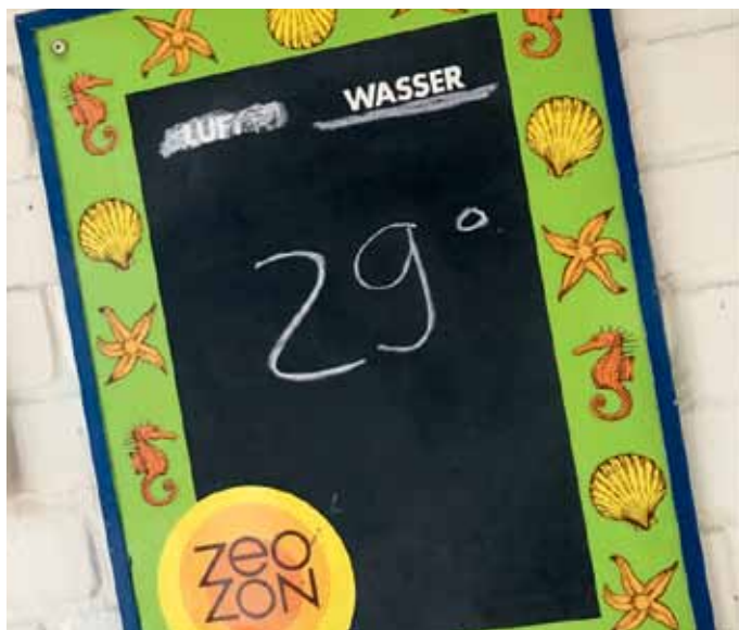
Ende Juli - die Wassertemperatur im Freibad Fischerteich.

Auch in den Freibädern Schwarzenbrink und Hiddesen ist die Zufriedenheit betreffend der Saison 2018 übermäßig ausgeprägt. Alles in allem war diese Saison ein wahres Sommermärchen. Einzig der Rasen auf den sonst so einladenden Liegewiesen hatte wenig Spaß am wärmsten Dorfsommer seit Jahren. Schon seit Ende Juni liegt man hier mehr oder weniger im Staub. Egal, die Mehrheit zieht es an diesen