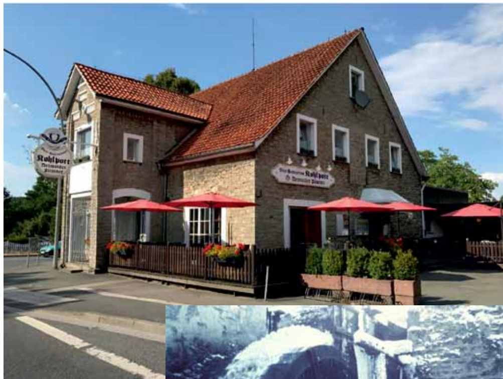
Der heutige „Kohlpott.“

Laut amtlichen Niederschriften tauchte der Krug erstmals im Jahr 1645 in den Historien auf. Lange Zeit war der Kohlpott der einzige konzessionierte Krug in Pivitsheide. Der Betreiber erhielt später als einziger in der Bauernschaft die Ausschankgenehmigung für Bier und Branntwein (erwähnt im Jahre 1751).