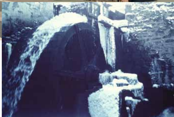
Das alte Mühlenrad der Kohlpötger Mühle.

Die heute bekannte Gebäude wurde im Jahr 1870 errichtet. 1889 wurde die Gaststätte um den Bau eines Saales erweitert. Es konnte und durfte also schon vor fast 130 Jahren im großen Rahmen gefeiert werden. Und auch im direkten Umfeld passierte nun einiges. Um 1900 herum entstanden dann weitere Ansiedlungen. Einige Jahre zuvor entstand bereits das gegenüberliegende Stauwerk, welches auch im Zusammenhang mit der Bewässerung der Wiesen der Familie Kohlpötger gebaut wurde.