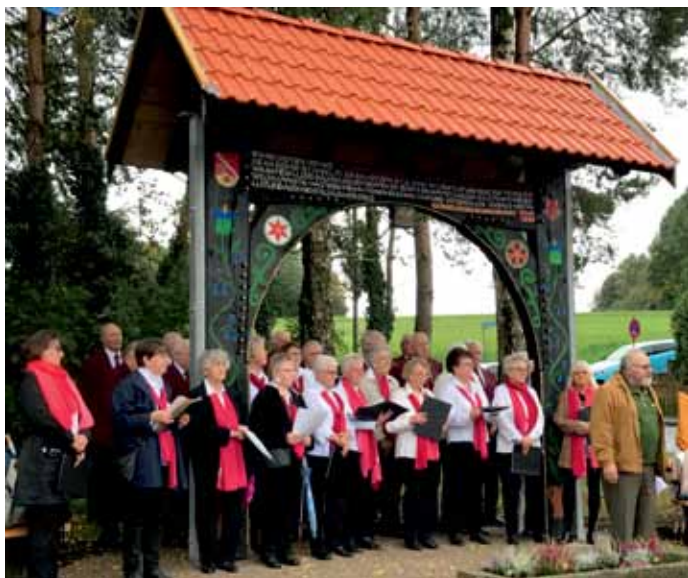
Der neue Torbogen als Bühne für den Chor „Deutsche Eiche“.

2016 ging dieser mittels einer Schenkung in den Besitz des Heimat- und Verkehrsvereins über - jedoch nur unter der Voraussetzung einer Instandsetzung und eines Wiederaufbaus.