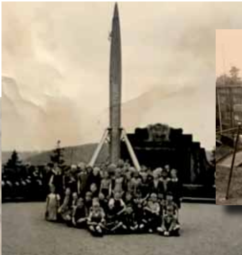
So nah kam man nie wieder dran! Eine Schulklass der Dorfschule vor dem demontierten Schwert.