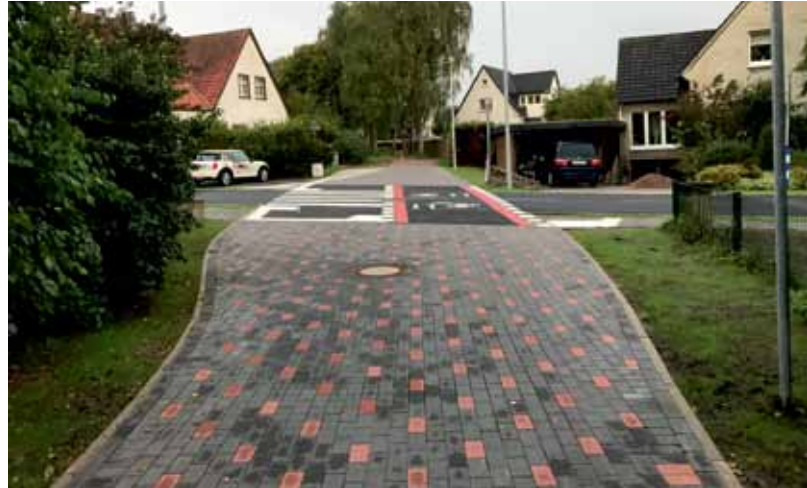
Vorfahrt für Radler am Übergang Waldheidestraße.