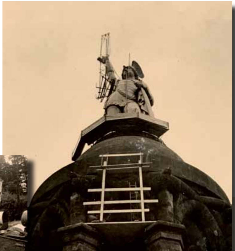
Einzigartig: Der Hermann ohne Schwert.

Die Lipper, ganz speziell die Hiddeser, waren stolz auf ihren Hermann - und das sind sie noch heute. Der Hermann ist auch für die nachfolgenden Generationen ein Symbol der Heimat und ein oft und gerne besuchter Dauergast hoch über unseren Dörfern.