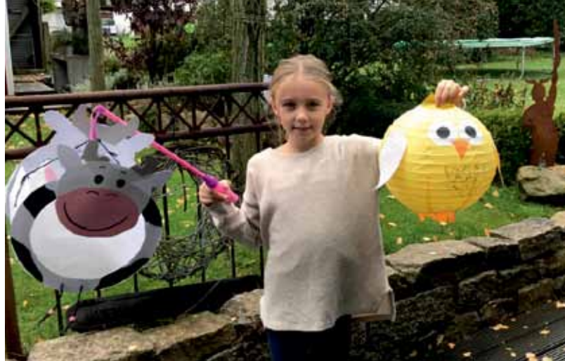
Das Basteln der Laternen schafft schon im Vorfeld viel Freude.

und singen ihre Lieder. Früher erhielten wir Äpfel und Birnen als Gaben. Heutzutage nehmen sich die Kinder gerne Süßigkeiten.“