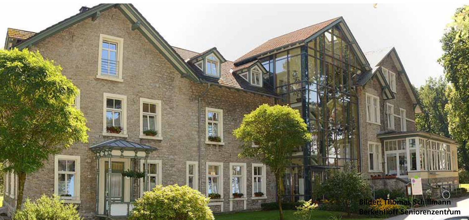
Bilder: Thomas Schillmann Berkenhoff Seniorenzentrum