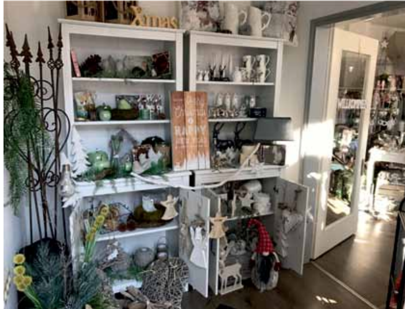
Klein aber fein. Home Living bietet viele, nette Überraschungen.