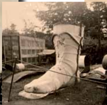
Mit einem Fuß auf dem Boden. Der rechte Schuh vom „Hermann“.