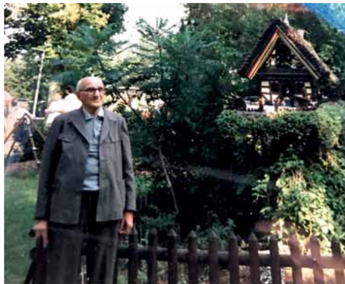
Einige Jahre später, der Alleskönner voller Stolz vor seinem Bauwerk.

Der frühere „Oberlokheizer“ war auch in seiner Freizeit ein „Original“. Mit seiner Kutsche und dem Pony Hannibal fuhr er am Wochenende seine Enkelkinder durchs Dorf. Für die Kleinen aus seiner Familie hatte der 1899 geborene „Lusendörper“ trotz seiner Arbeit und seinem Hobbs immer Zeit.