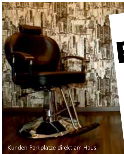
Kunden-Parkplätze direkt am Haus.