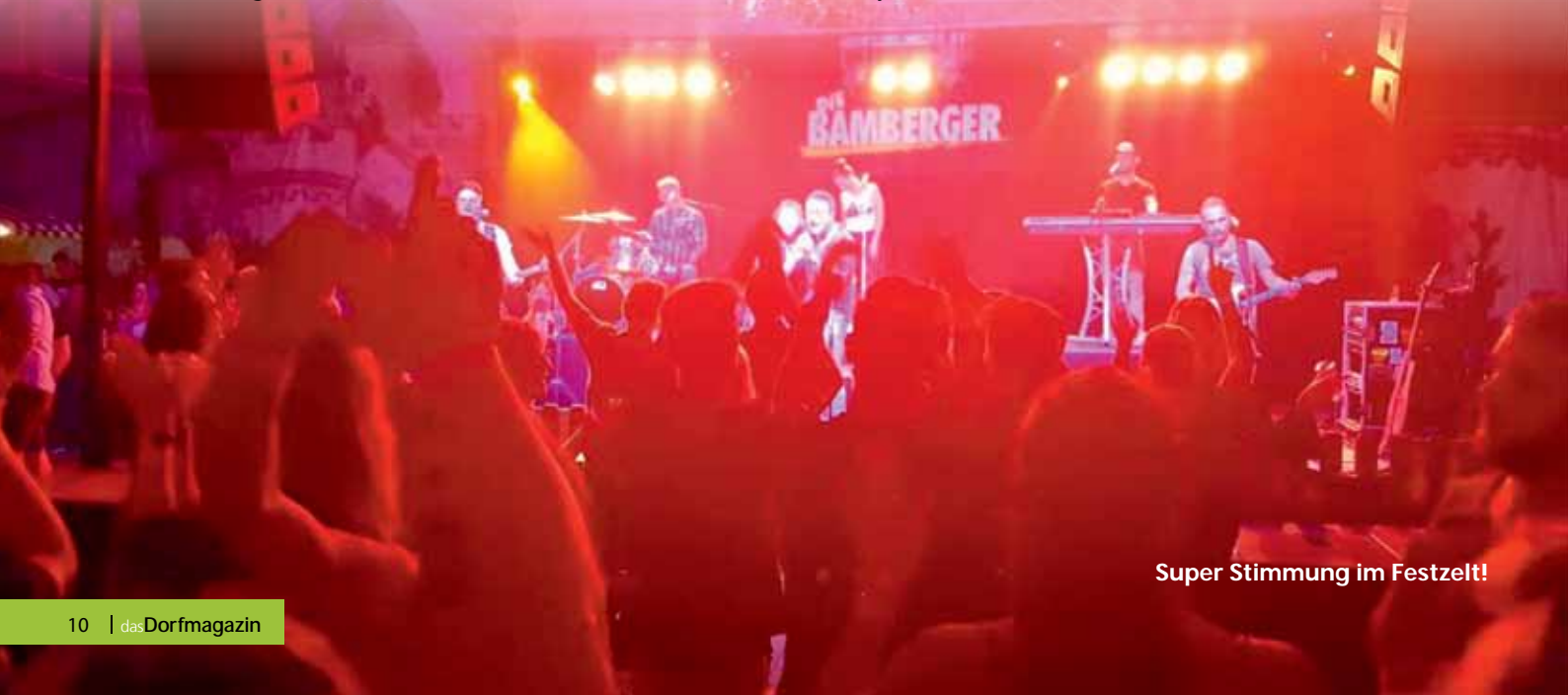
Super Stimmung im Festzelt!

Als wir den Festplatz verlassen, freut es uns, auch zahlreiche positive Feedbacks bekommen zu haben. Und so hoffen wir also, dass wir uns auf den kommenden „Bällen“, Weihnachtsmärkten, Wiesenfesten, Parkfesten und Osterfeuern mal wiedersehen, die Hände schütteln und uns gepflegt amüsieren und über die alten Zeiten plaudern - das wäre auch ohne Handy echt „like“ ;).