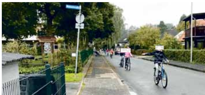
Die Klasse 4b übt für die Radfahrprüfung.

Die jungen Radler übten für die Radfahrprüfung und das Dorfmagazin durfte aktiv als Streckenposten dabei sein. Zu sehen waren neben vielen lachenden Gesichtern auch einige traurige. Grund hierfür war nicht das unpassende Wetter, sondern der teilweise bedauernde Zustand der schuleigenen Räder. Defekte Bremsen, kaputte Schutzbleche und fehlende Klingeln schafften beim Üben so gar keine gute Laune. Alle Dörfler, die noch ein brauchbares Kinderrad in der Ecke stehen haben,