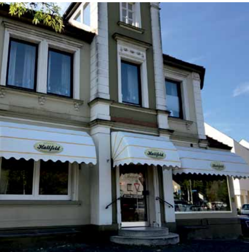
Die Dorfbäckerei Hallfeld im denkmalgeschützten Haus im Ortskern von Heidenoldendorf.

(dd) In unseren Dörfern ist - im wahrsten Sinne des Wortes - das Handwerk zu Hause. Es gibt kaum ein Gewerk, das nicht in einem unserer Dörfer beheimatet ist - als Dörfler, als Macher, als Arbeitgeber.