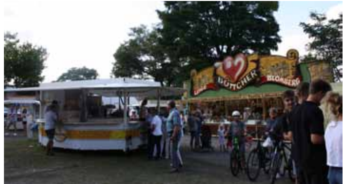
In den Nachmittagsstunden fehlt es an Besuchern. Auch wir Dörfler sind gefragt, mit unserem Besuch die Tradition zu erhalten.

Uns gegenüber äußern sich einige Pivitsheider sehr kritisch in Bezug auf den Kussler Ball. „Da ist ja nix mehr los“, sagt uns eine Pivitsheiderin (die nicht namentlich genannt werden möchte). Ob Sie selber denn vor Ort war? „Nö“, sagt sie handguckend. Das typische Nörgeln fällt halt leichter, als der Ursache mit dem eigenen „Vorwegmarschieren“ mal die Hammelbeine lang zu ziehen.