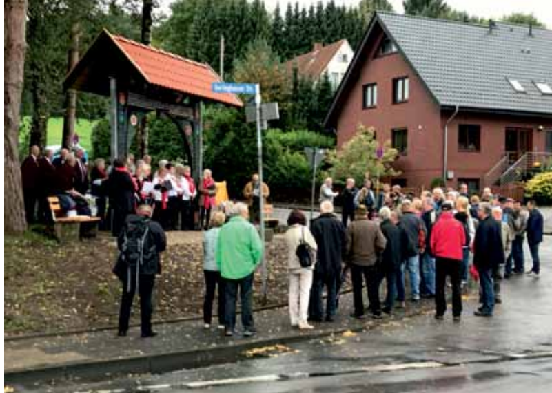
Trotz Wind und Regen: Auf die Dörfler ist Verlass.

Nun also, steht der neue Torbogen - restauriert und für alle gut sichtbar - an der Oerlinghauser Straße. Zur feierlichen Einweihung erschienen, trotz des grauen Herbstwetters, zahl-