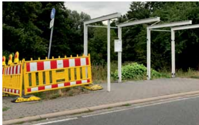
Mit dem Rückbau des Haltestellenhäuschens und der Sperrung des Radweges scheint die Großbaustelle zu beginnen.

Fest steht aber, dass die Heidenoldendorfer Straße den Bauabschnitten entsprechend für den Durchgangsverkehr voll gesperrt wird. Ende August wurde die Absperrung für den nördlichen